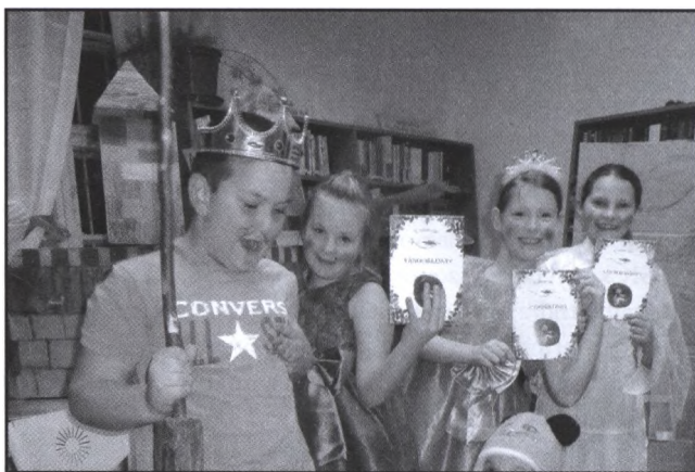
A vámosgyörki e'mese csapat Macskació előadása

A második próba teljes egészében a település könyvtárosára volt bízva. Ez a próba az alkotásról szólt. Egy – a gyerekek és a könyvtáros által együttesen választott – mese volt az alapja ennek az alkotó tevékenységnek. Ezzel kapcsolatban sem volt semmiféle kitételünk, elvárásunk. Abba az irányba próbáltuk mozdítani a gyerekeket segítő könyvtárost, hogy olyasmit csináljanak, amihez leginkább affinitást éreznek. Volt, aki színházi előadást csinált; voltak, akik rejtvényt, mások ,kölevest, csuda-fát készítettek. Ez kapunyitás volt afelé, hogy minél szabadabban, bátrabban alkossanak, talán még a nem oly távoli jövőben is.