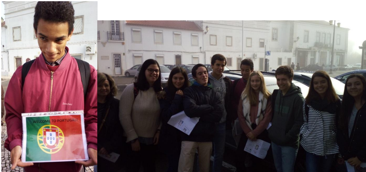
Portugál diákok, akik bemutatták a helyi legendákat

2018. október 1. és 2020. szeptember 30. között zajlik le a tervezett öt stratégiai partnerségi találkozó. A Debreceni Ady Endre Gimnázium 2019 tavaszán lesz házigazdája az első, diákok részvételével történő mobilitásnak. A calabriai (2019 ősz), székelykeresztúri (2020 tavasz) és szicíliai (2020 nyárelő) utazáson részt vevő diákokat (15-18 éves korosztály) közösen kialakított szempontsor szerint választják ki tanáraik, tesztelve kreativitásukat, nyelvi és IKT kompetenciáikat. Online szövegértéses és műveltségi feladatlapot töltenek ki az 5 legenda mentén, logót terveznek a projekt számára, s motivációs levelet írnak.