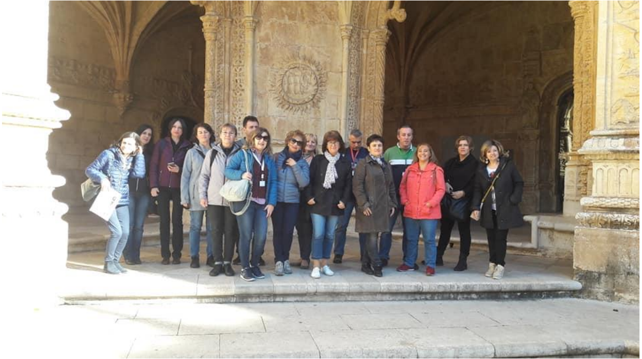
Lisszabon, Szent Jeromos-kolostor, Alexandre Herculano síremlékénél

Fernando Pessoa, José Saramago, Alexandre Herculano szobrainak, síremlékének meglátogatása mellett a portugál történelem főbb eseményeibe is beleláthattak. A vendéglátók mély hazaszeretete, patriotizmusa, történelemszemlélete, értékrendje, nemzeti hagyományokhoz való ragaszkodása, büszke nemzeti öntudata megható volt. November 14-én sintrai mítoszok és legendák nyomában járt a tanári csoport, a Quinta da Regaleira és a Palácio da Pena palotáit, kertjeit megcsodálva a portugál történelem újabb legendás helyszínén készíthettek fotókat, filmeket a későbbi legendafeldolgozáshoz. A portugál legenda diákokkal való feldolgozása – a tervekkel ellentétben - Magyarországon lesz. Debrecenben egyszerre két legendával fognak dolgozni a diákok. Ehhez nagy segítséget jelentenek az egymásnak átadott módszerek, kreatív ötletek, prezentációk, forgatókönyvek. November 15-én Tomarba, a Santa Íria legenda egyik fontos helyszínére és Fátimába, az egyik legismertebb jelenés helyszínére, majd az európai kontinens legnyugatibb pontjára, Peniche-be is elkalauzolták a szervezők vendégeiket.