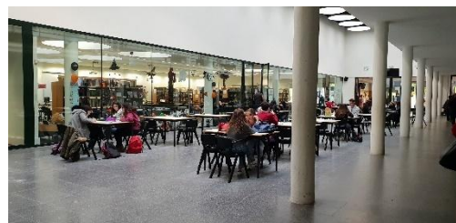
A helyi iskolai könyvtár